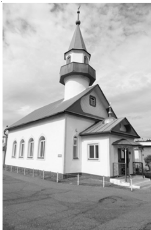
Рис. Мечеть «Акбюл»

оборудованы молельные комнаты, а в трех самых крупных, с лимитом содержания 1000 и более человек, действуют мечеть и православный храм. Первая мечеть появилась на территории Исправительной колонии № 4 (г. Салават-6, 152 км автодороги Уфа – Оренбург, N53°24'56,54"; E55°50'45,12"). Причем эта мечеть стала первым культовым сооружением для мусульман в системе ФСИН не только в регионе, но и по всей Российской Федерации.